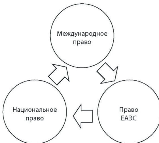
Рис. 1. Возможные правовые коллизии