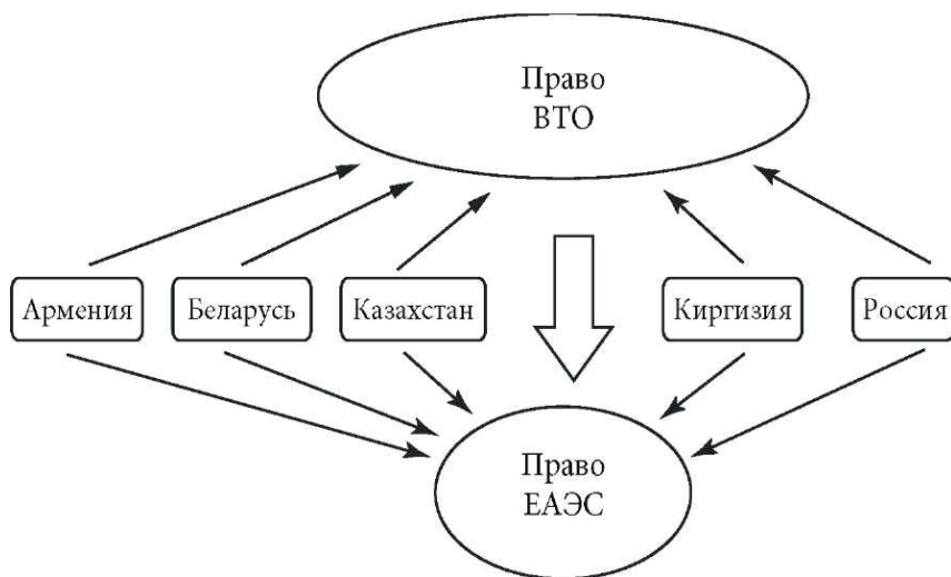
Рис. 2. Взаимодействие правовых систем

С точки зрения права ЕАЭС центральную роль в вопросе согласования правопорядков ВТО и ЕАЭС играет Договор от 19 мая 2011 г. «О функционировании Таможенного союза в рамках многосторонней торговой системы» (далее — Договор 2011 г.), являющийся неотъемлемой частью права ЕАЭС (приложение № 31 к Договору о ЕАЭС). Договор 2011 г. изначально преследовал цель избежать противоречий между обязательствами членов Таможенного союза и обязательствами, вытекающими из членства в ВТО. Для этого в Договоре 2011 г. был заложен определенный механизм, который применяется для снятия потенциальных противоречий норм ЕАЭС и ВТО 1 . Основными подходами, на которых базируется Договор 2011 г., являются следующие.